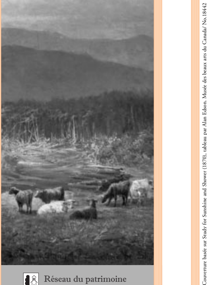
Couverture basée sur Study for Sunshine and Shower (1870); tableau par Alan Edson. Musée des beaux-arts du Canada, No. 18442

La baie Missisquoi, sur le lac Champlain, abrita des réfugiés pendant la Révolution américaine. En effet, pendant les années 1770 et 1780, ils vinrent au Québec par milliers, surtout des vallées du haut des rivières Hudson et Mohawk de l'état de New York.